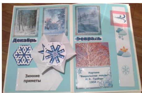
Лэпбук «Зима» (слайд 1,2,3)

Термин «Lapbook» впервые был придуман Тэмми Дюби, писателем из Вирджинии, США. Такое название дано, потому что весь проект может быть вписан в книгу, которая помещается в коленях ребенка. Если переводить дословно, то лэпбук (lap – колени, book – книга) – это книжка на коленях. Часто можно встретить и другие названия: тематическая папка, интерактивная папка, папка проектов. Но суть сводится к тому, что лэпбук – это самодельная интерактивная папка с кармашками, мини-книжками, окошками, подвижными деталями, вставками, которые ребенок может доставать, переключать, складывать по своему усмотрению. В ней собирается материал по какой-то определенной теме.